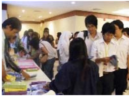
นักศึกษาลงทะเบียน

เอกสารแจกในงาน จำนวนแผ่นสืบ IPUS1 200 ชุด จำนวนแผ่นสืบ IPUS2 200 ชุด จำนวนแผ่นสืบ IPUS3 200 ชุด จำนวนแผ่นสืบ RPUS 200 ชุด หนังสือคู่มือขอรับทุน 200 เล่ม