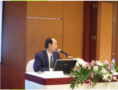
ผู้จัดการ โครงการ IRPUS สาขา 2