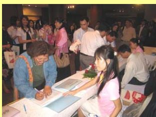
ผู้เข้าร่วมงาน ร่วมลงทะเบียนก่อนจัดงาน