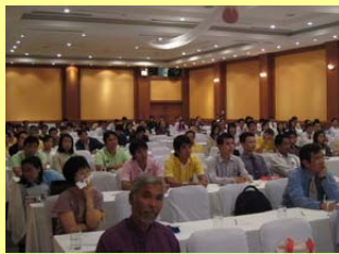
คณาจารย์และผู้ประกอบการ ที่เข้าร่วมรับฟัง