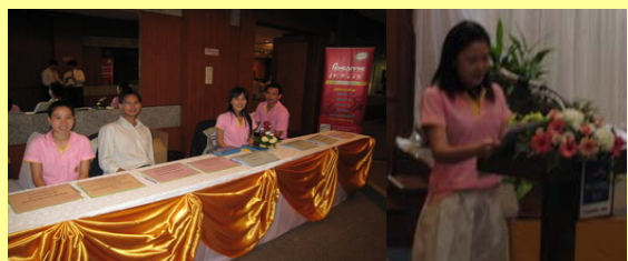
ทีมงาน สำนักประสานงานโครงการ IRPUS สาขา 3, IRPUS (หลัก) และ (สาขา 2) ร่วมให้คำปรึกษากับผู้เข้าร่วมงาน