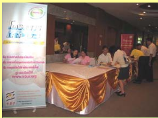
ทีมงาน สำนักประสานงานโครงการ IRPUS สาขา 3 (เชียงใหม่) รับลงทะเบียน