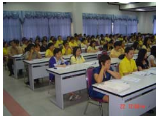
ภาพผู้เข้าร่วมประชุมรับฟังการชี้แจงโครงการฯ